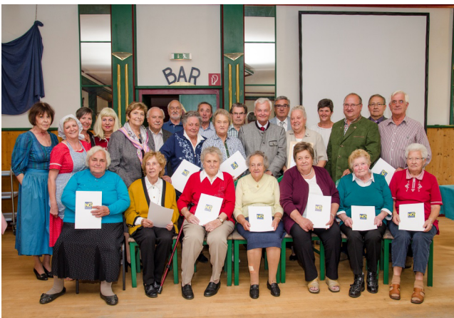
Die bei der 55 Jahr-Feier geehrten Mitglieder und Funktionäre des Seniorenbundes Kautzen

Der Verein war redlich bemüht, ein attraktives Programm auf die Beine zu stellen. Neben einer interessant gestalteten Videoschau über die Geschichte des Seniorenbundes Kautzen bereitete die TAM- Theatergruppe aus Waidhofen/Thaya mit ihren Beiträgen den Besuchern ein besonderes Vergnügen. Ein weiterer Programmpunkt umfasste die Ehrung verdienter Mitglieder und Funktionäre.