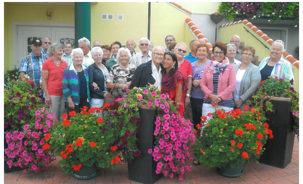
Kautzens Senioren besuchen die Südoststeiermark

zeugung, der Töchterlehof, die Apfelstraße und das Stoanihaus.